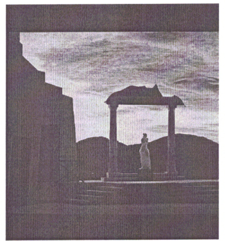
Una scena di Giove a Pompei, rovine della città sepolta dalla lava

città di Foggia e dal Teatro "Giordano", in collaborazione con il Conservatorio "Giordano", l'Accademia di belle arti, l'Università di Foggia e le Fondazioni "Apulia Felix" e "dei Monti Uniti" di Foggia. La rappresentazione di "Giove a Pompei" gode del sostegno di ministero dei Beni e delle attività culturali, Regione Puglia, "Pompeo Parco Archeologico", in collaborazione con il Teatro pubblico pugliese. Per lo spettacolo (a ingresso gratuito), sono stati organizzati bus che da Foggia partiranno in A/R per Pompei. Per acquistare i biglietti (costo: 5 euro) ci si potrà rivolgere al botteghino del Teatro "Giordano". In prima esecuzione in tempi moderni, riportata in scena dopo 96 anni, la commedia musicale in tre atti è scritta da Giordano a quattro mani con Franchetti su libretto di Illica e del grecista Ettore Romagnoli. La partitura orchestrale era negli archivi storici di Casa Ricordi, ora recuperata eccezionalmente per questa occasione. "Operetta è un vezzeggiato di opera, ma in questo caso è un genere musicale e questo significa che non è un po' meno di niente - sostiene Gianna Fratta - Si tratta di un'alternanza di musica con parti recitate e una serie di colpi di scena. Il pubblico assisterà a tante trovate, ad esempio l'ingresso del Faraone, l'eruzione del Vesuvio e la discesa di